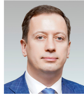
Первый заместитель директора