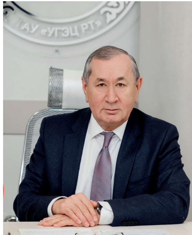
Директор Госэкспертизы РТ